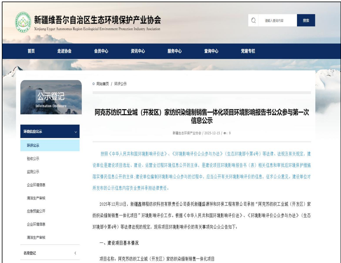
图1 首次环境影响评价信息网络公示截图