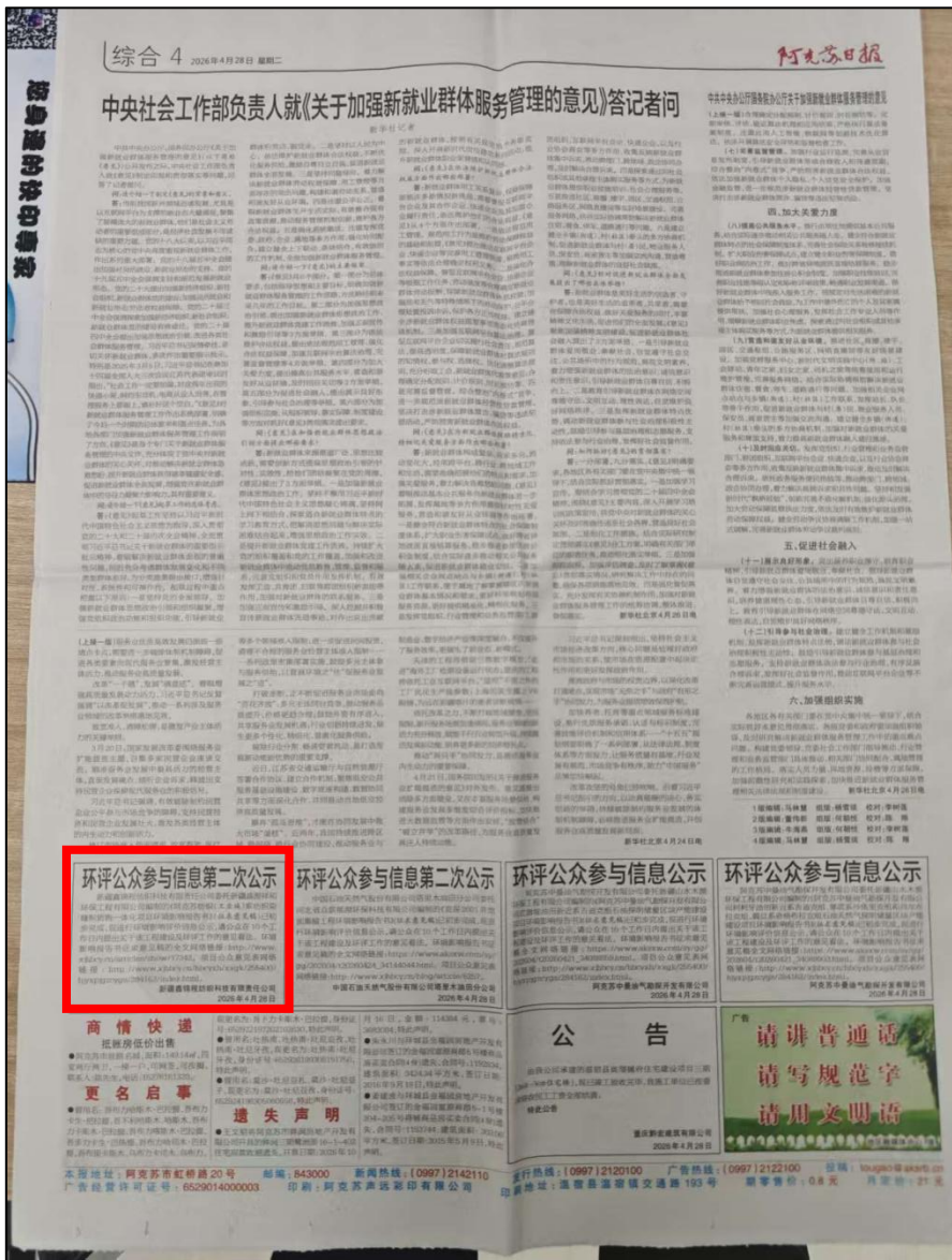
图4 征求意见稿第二次报纸公示照片