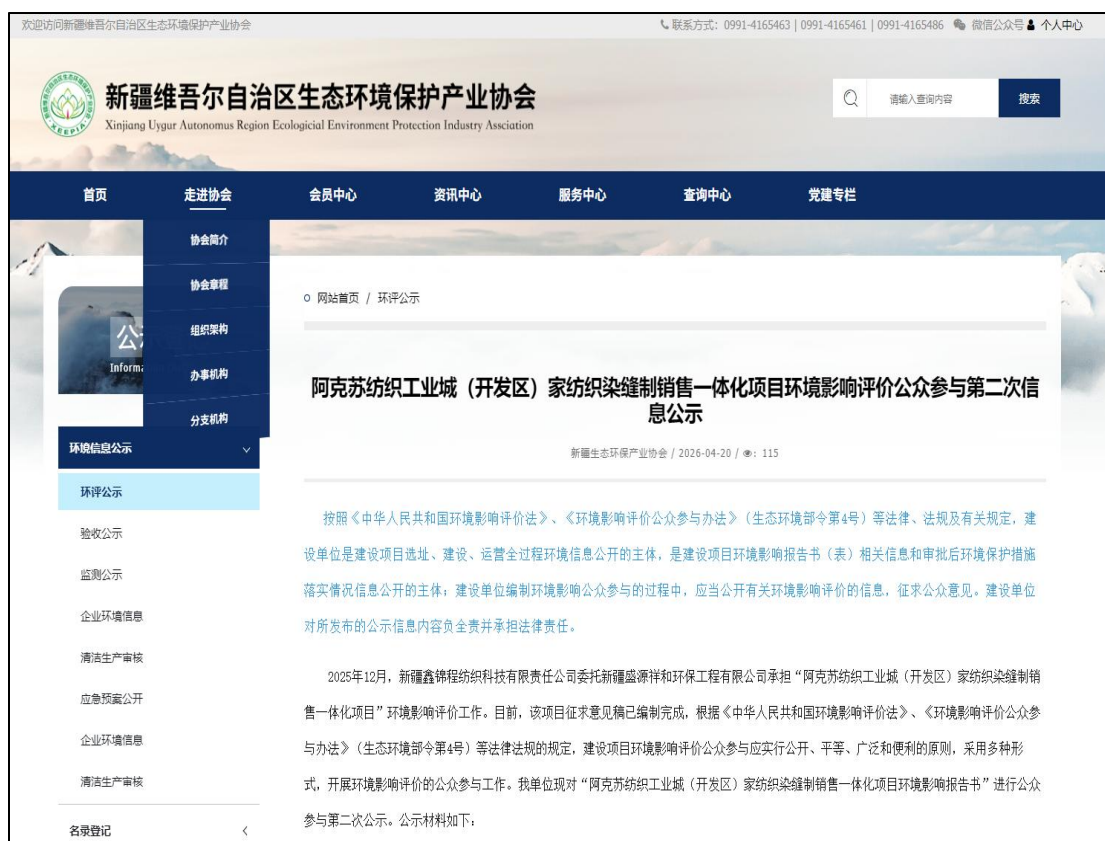
图2 征求意见稿网络公示截图