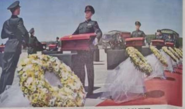
第十三批在韩中国人民志愿军烈士遗骸回国

新华社北京4月22日电 共青团中央、教育部、工业和信息化部等15部门联合印发《关于深化青年发展型城市建设的意见》。《意见》提出，要坚持以青年发展为导向，统筹推进青年发展型城市建设，为青年创新创业、就业创业、创新创业提供良好环境。《意见》要求，要深化青年发展型城市建设，要坚持以青年发展为导向，统筹推进青年发展型城市建设，为青年创新创业、就业创业、创新创业提供良好环境。